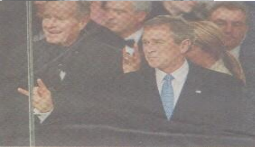
布殊在就職禮儀展示一類手勢，但在該處被視為致敬且手勢。